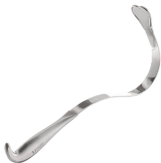
HARRINGTON RETRACTOR GRANDE H.P..