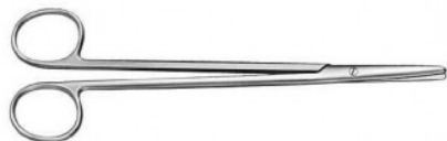
TIJERAS METZEMBAUM 18 CM RECTA DESPUNTADA