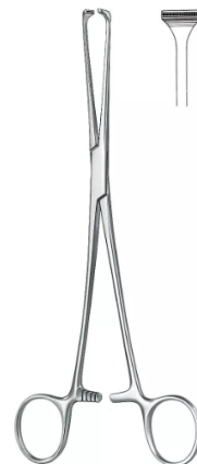
PINZA DE ALLIS PREMIUM 25 CM ACERO INOXIDABLE