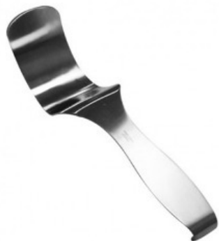
DEAVER RETRACTOR 1 X 13 H.P.