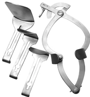
SULLIVAN O CONNOR RETRACTOR H.P.