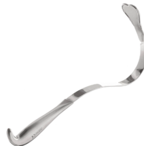
HARRINGTON RETRACTOR 12 MEDIANO H.P.