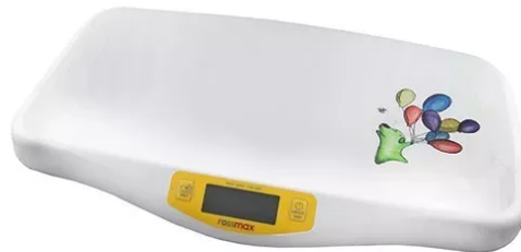
BÁSCULA PEDIATRICA DIGITAL 20KG ROSSMAX CON SENSOR FUNCION HALT