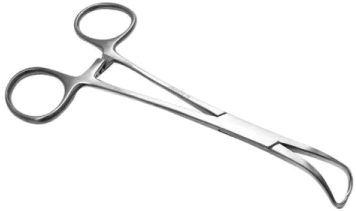
PINZA CAMPO BACKHAUS 13 CM ACERO INOXIDABLE