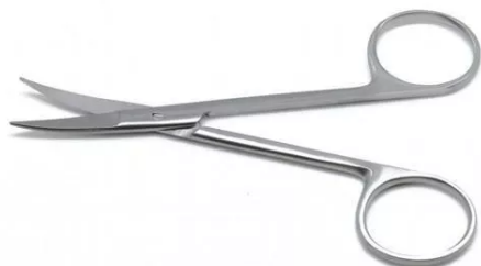
TIJERAS DE IRIS CURVA ACERO INOXIDABLE 9 CM REUTILIZABLES