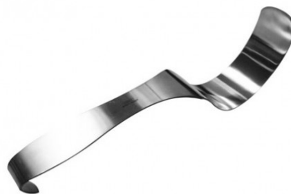
DEAVER RETRACTOR 2 X 13 H.P.