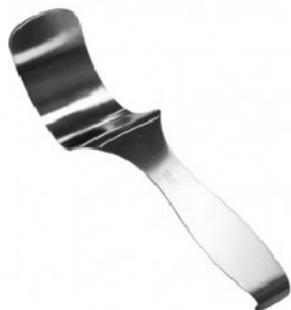
DEAVER RETRACTOR 3 X 13 H.P.