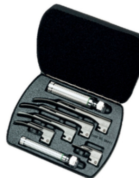
SET DE LARINGOSCOPIO HOJA WELCH ALLYN COMPLETO ESTUCHE, 5 HOJAS Y MANGO