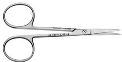
TIJERAS DE IRIS RECTA 9 CM ACERO INOXIDABLE