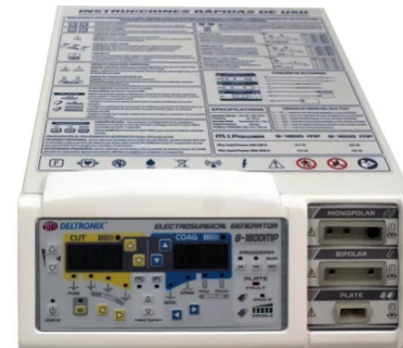
UNIDAD DE ELECTROCIRUGÍA DELTRONIX 150 W BIPOLAR Y PULSE