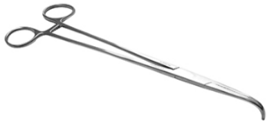
MIXTER PINZA 23 CM HORIZONTAL H.P.