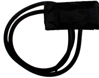
ESFIGMOMANÓMETRO DE BRAZALETE PEDIÁTRICO