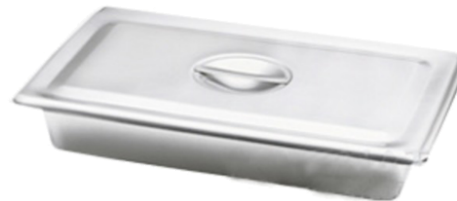
CHAROLA RECTANGULAR ACERO INOXIDABLE PARA INSTRUMENTAL CON TAPA