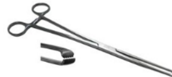
ALLIS WILLHAUER PINZA 5 X 6 25 CM H.P