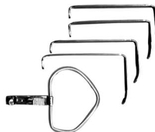
MCIVOR ABREBOCAS H.P.