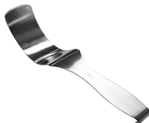
DEAVER RETRACTOR 2 1/2 X 13 H.P.