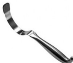
HARRINGTON RETRACTOR CHICO H.P.