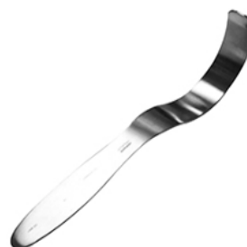
DEAVER RETRACTOR PEDIATRICO 3/4 X 8 H.P.