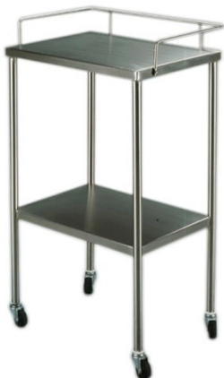
MESA DE PASTEUR 10CM CUBIERTA DE ACERO INOXIDABLE RODAJAS GIRATORIAS