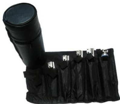
ESTUCHE DE LARINGOSCOPIO MILLER 5 HOJAS LUZ ESTANDAR (1,2,3,4,5) H.P