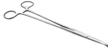
MIXTER PINZA 23 CM SERRACIÓN VERTICAL H.P.